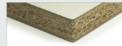
ДСП с покрытием из HPL

Рекомендации по использованию Особенно пригодный, например, для следующих материалов