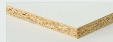
ДСП с меламиновым покрытием