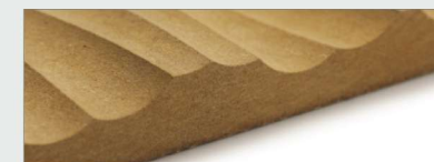
МДФ без покрытия