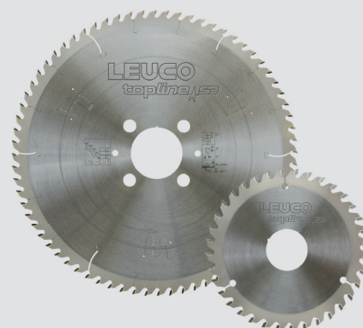
LEUCO Special Edition